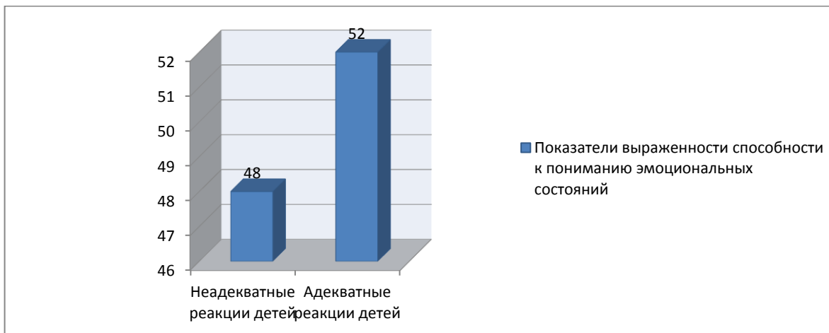
Рис. 1. Понимание эмоциональных состояний окружающих у младших школьников

Данные по методике «Изучение понимания эмоциональных состояний людей, изображённых на картинке» (Г.А. Урунтаева, Ю.А. Афонькина), представлены на рис. 2, 3.