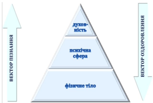
Рис. 1. Валеологічна тактика пізнання й оздоровлення (М.С. Гончаренко)

Актуальним для нас є розділ III. «Валеологія як ноосферна наука», де з системного підходу, яке прийнято у валеології, представлено структурну організацію людини у формі піраміди (рис. 1), основою якої є фізичне тіло, психічна складова здоров'я (інтелектуально-емоційна сфера) – середня частина піраміди і духовна складова – вершина піраміди, запропонована М. Гончаренко [9, с. 57].