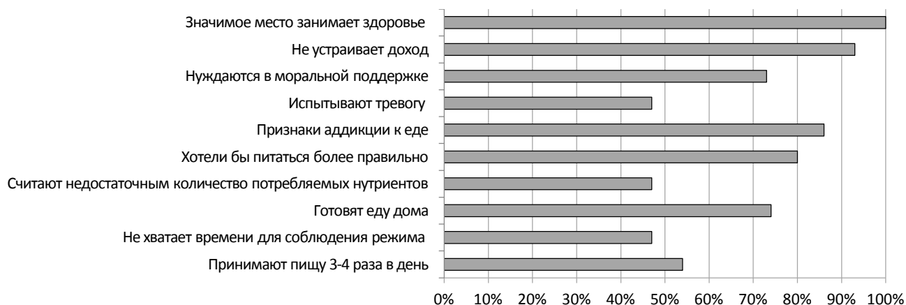
Рис. 2. Анализ анкетных данных женщин с хроническим панкреатитом

34 % соблюдают режим питания, и 20 % женщин отмечают, что им не хватает терпения соблюдать режим приема пищи. Таким образом, выявлен низкий уровень приверженности к соблюдению режима питания и высокий уровень (в 88 % случаев) нарушений рекомендаций по питанию. 74 % женщин готовят дома и питаются домашней едой. У 26 % женщин нет возможности в течение дня питаться в домашних условиях, они социально активны, из них 13 % питаются в столовых и 13 % берут еду с собой.