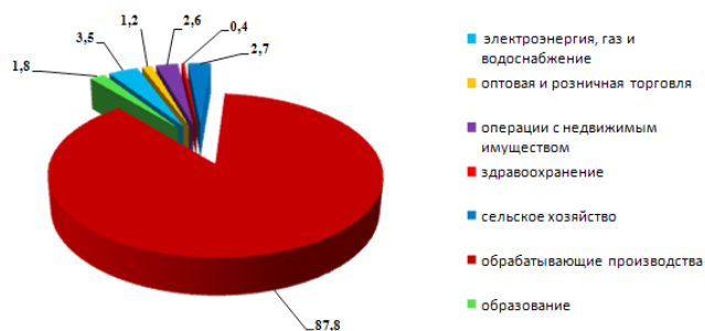
Рис. 1. Структура экономики Княгининского района за 2013 год

В 1990г. возник так называемый «русский крест», или «русские ножницы» (по России в 1992г.), когда кривая падения рождаемости пересеклась с кривой роста смертности, в результате чего возник эффект естественной убыли населения Княгининского района (рис. 2).